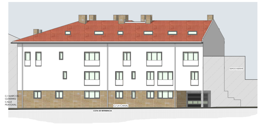
alzado norte e_1/300