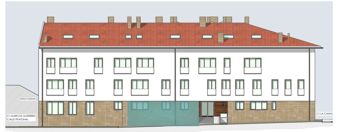
alzado este e_1/300