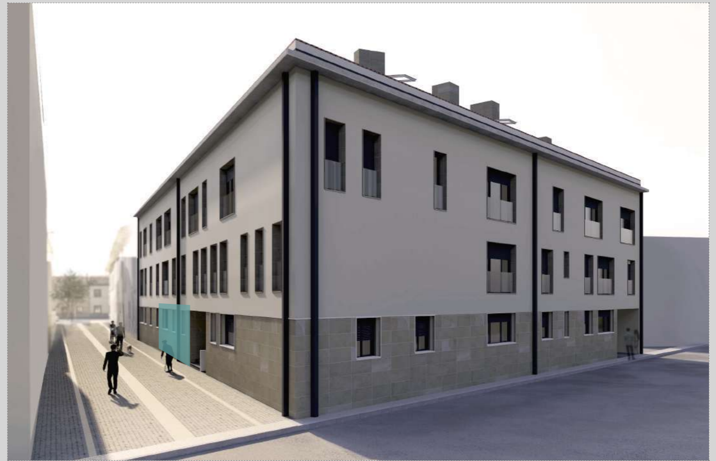
vista general ACCESO