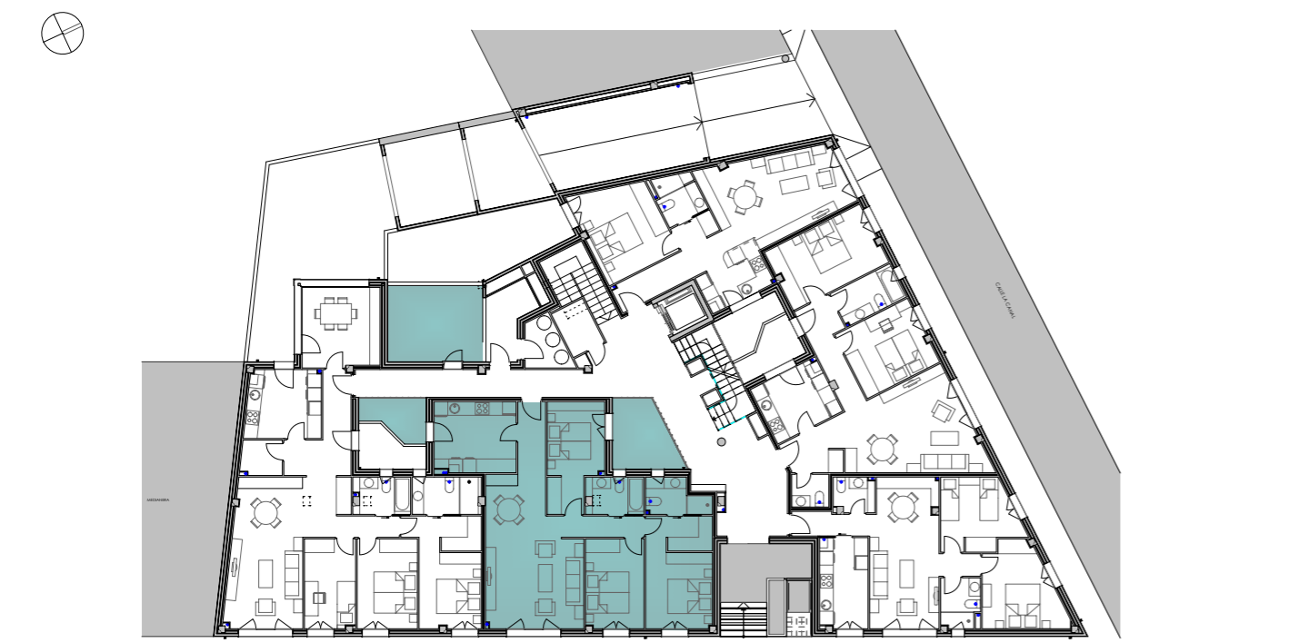
planta baja e_1/300