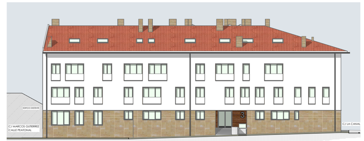
alzado este e_1/300