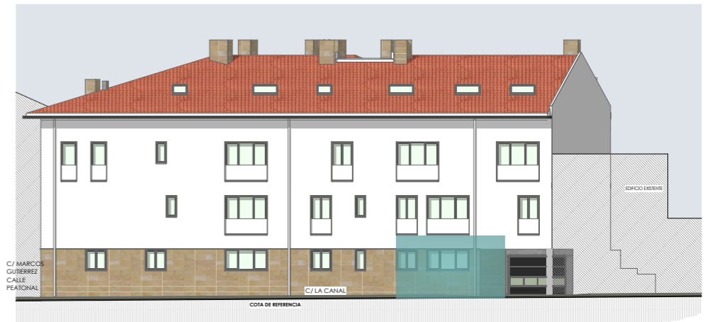
alzado norte e_1/300