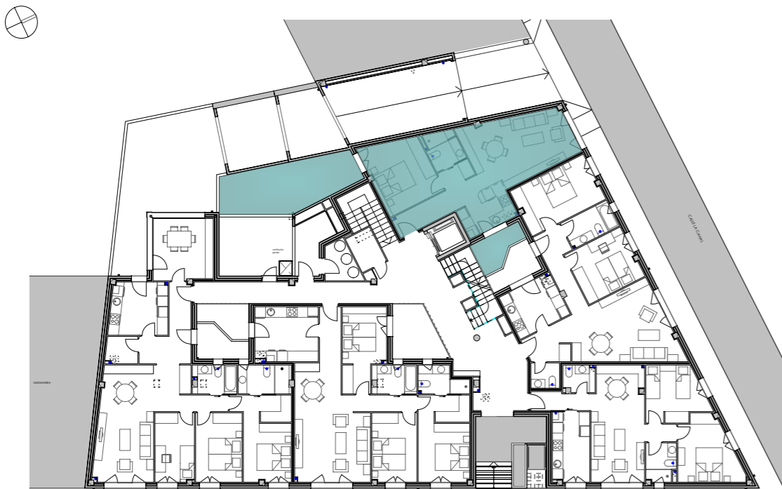
planta baja e_1/300