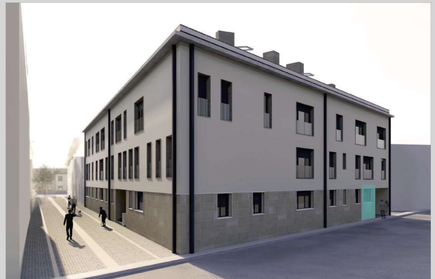
vista general ACCESO